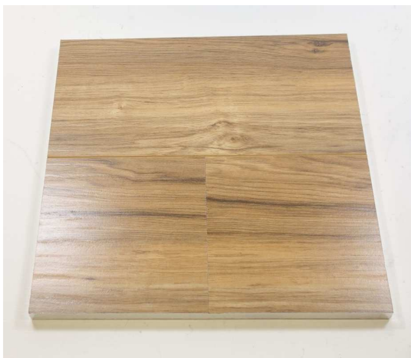
A001: Golden Select, Sandstone